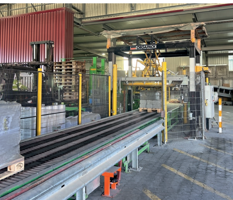
Les paquets finis sont transportés par des convoyeurs à rouleaux vers la banderoleuse automatique Octopus, puis récupérés par un chariot élévateur au point de transfert.

couverture et un film étirable, puis récupérés par un chariot élévateur au point de transfert. L'installation est commandée par un chariot élévateur électrique de 5 tonnes équipé d'une fourche rotative.