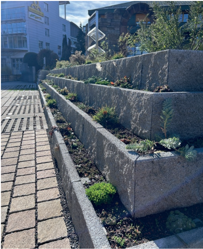
Dans le jardin d'exposition, les personnes intéressées peuvent se convaincre de la diversité et de la haute qualité des produits de Rickenbach.