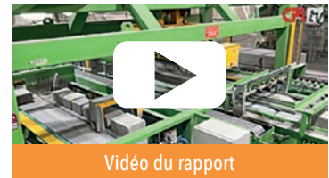
Vidéo du rapport