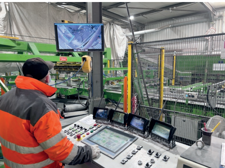
Tout sous les yeux : pupitre de commande de l'installation de tri et de palettisation

Plus de 15 ans d'expérience dans la fabrication de planches. Polblat propose des planches en bois et des planches en contreplaqué avec revêtement polyuréthane